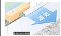
新壁パッケージ工法 [全体換気工法]