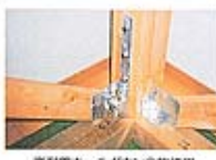
高耐震ホールダウン金物使用