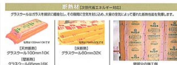
断熱材 [次世代省エネルギー対応]

グラスウールはガラスを繊維化し、その隙間に空気を封じ込み、大量の空気によって優れた断熱性能を発揮します。